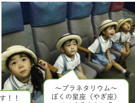
～プラネタリウム～ ぼくの星座(やぎ座) でてるかなー?