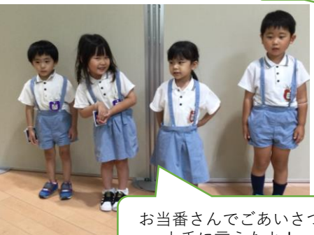
お当番さんであいさつ 上手に言えたよ!