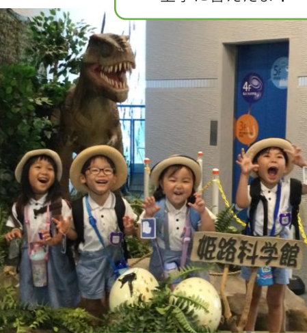
触るとざらざらしてるね!