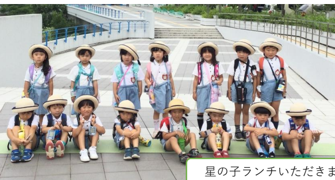
星の子ランチいただきます!!

姫路科学館へ体験学習に行ってきました。プラネタリウムでは、七夕特別投影 たなばた「星まつり」を鑑賞しました。おりひめさまとひこぼしさまがでてきたり自分の星座を見つけたりして興味津々でした。昆虫コーナーでは、初めて見る虫を見て「かっこいい!!」「また捕まいたい!」という声が聞こえたり、化石を見て、感じて触っての楽しい経験ができました。