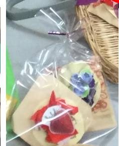
袋に入れて持ち帰りました!!