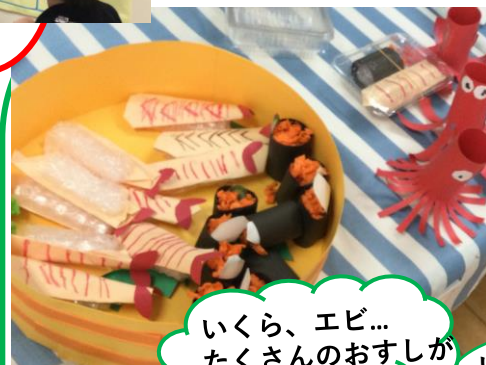
いくら、エビ... たくさんのお寿司が 並びました!!