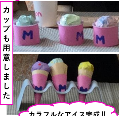
カラフルなアイス完成!!