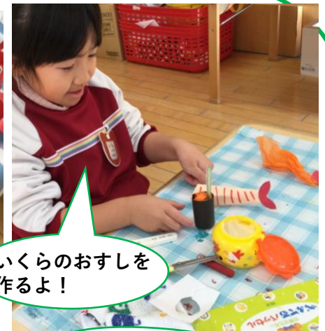
いくらのお寿司を 作るよ!