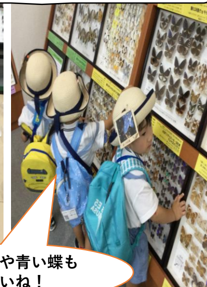
黄色の蝶や青い蝶も いてきれいね！