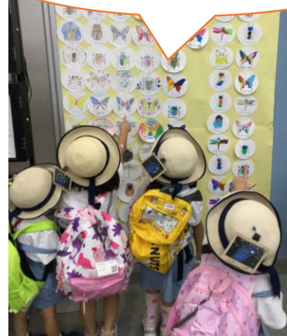
ぼくたちの虫は どこかな？