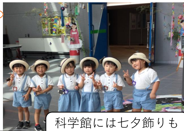
科学館には七夕飾りも ありました