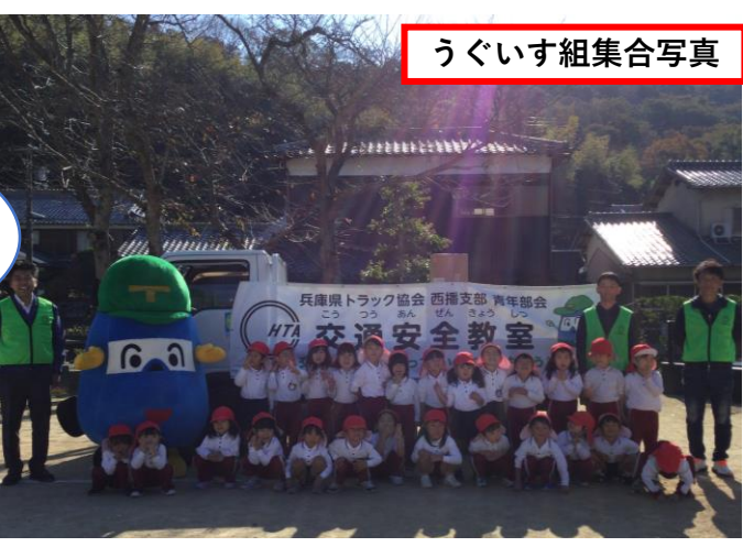
うぐいす組集合写真