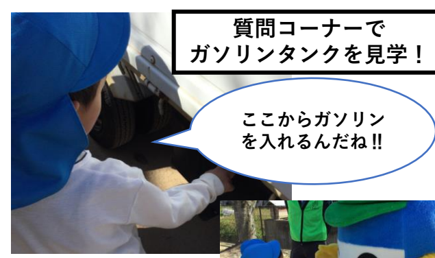
質問コーナーで ガソリタンクを見学！