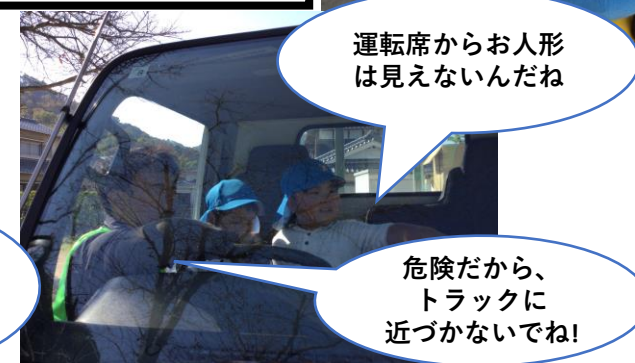
運転席乗車体験で 見えない場所を確認