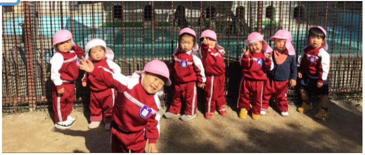
ペンギン舎前での子どもたち