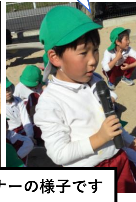
質問コーナーの様子です